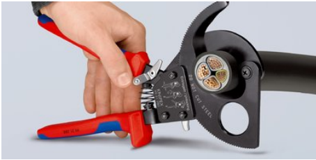
95 31 250/280: kiinteäkylkinen vaippa terien kiinnitykseen leikkattaessa