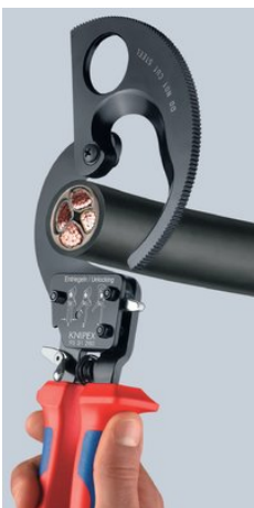
95 31 280: suuri kapasiteetti: max. Ø 52 mm / 380 mm 2