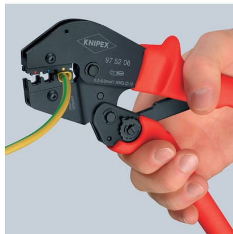
Toinen askel: Nyt toista kättä voidaan käyttää seuraavaan puristukseen